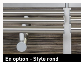
En option - Style rond

Rampe à plateaux 3 profilés trapézoïdaux en aluminium thermolaqué gris inox sur réhausses, consoles support section 40x40 mm